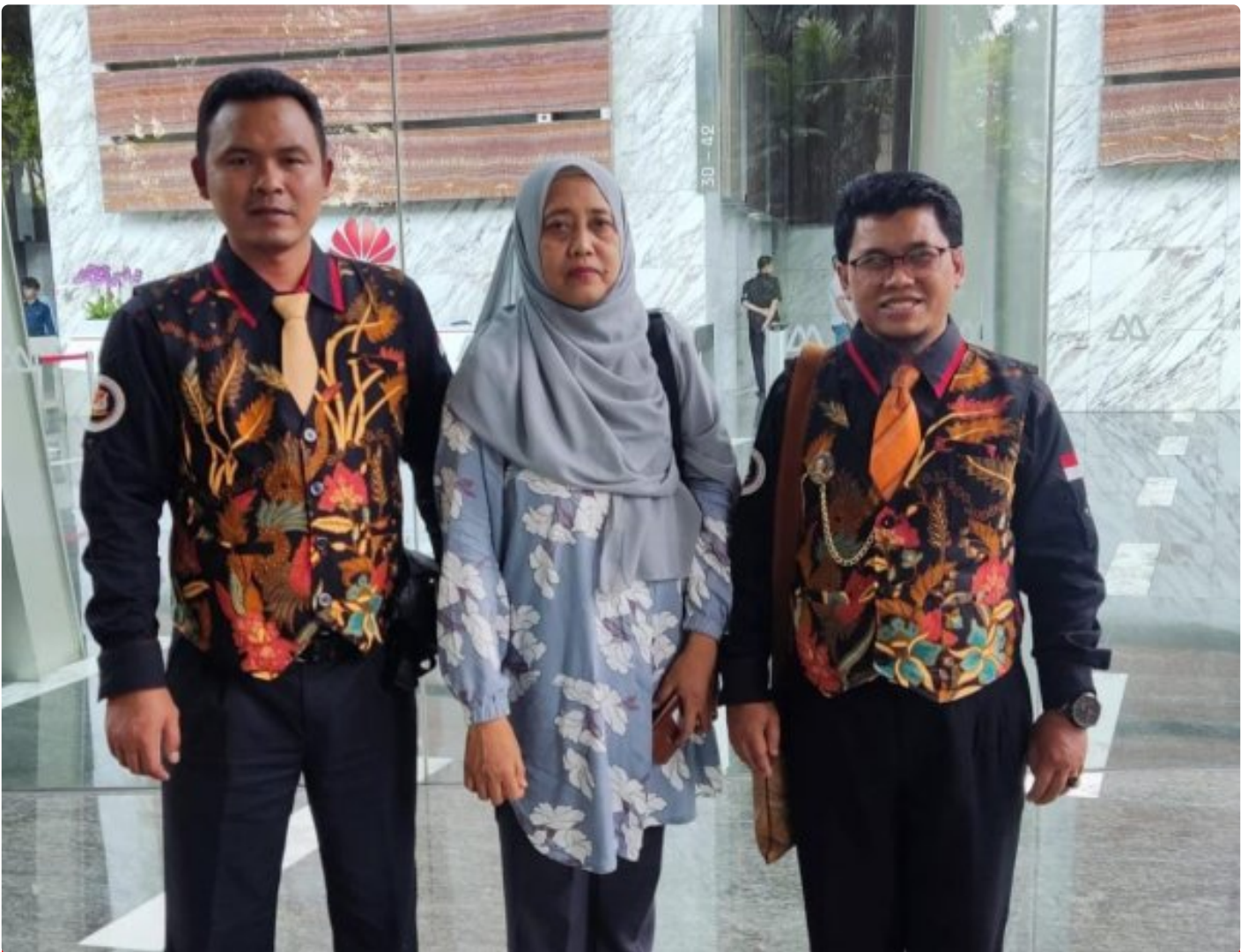
Foto: Tim LIDIK KRIMSUS RI melaporkan dugaan penyimpangan ini ke Komisi Pemberantasan Korupsi (KPK) dan Otoritas Jasa Keuangan (OJK), menuding adanya praktik kotor yang dilakukan oknum PT. Bank Negara Indonesia (Persero) Tbk di Kota Semarang. Senin (04/11/2024).

JAKARTA- Tim Divisi Hukum Lembaga Informasi Data Investigasi Korupsi dan Kriminal Khusus Republik Indonesia (LIDIK KRIMSUS RI) baru saja